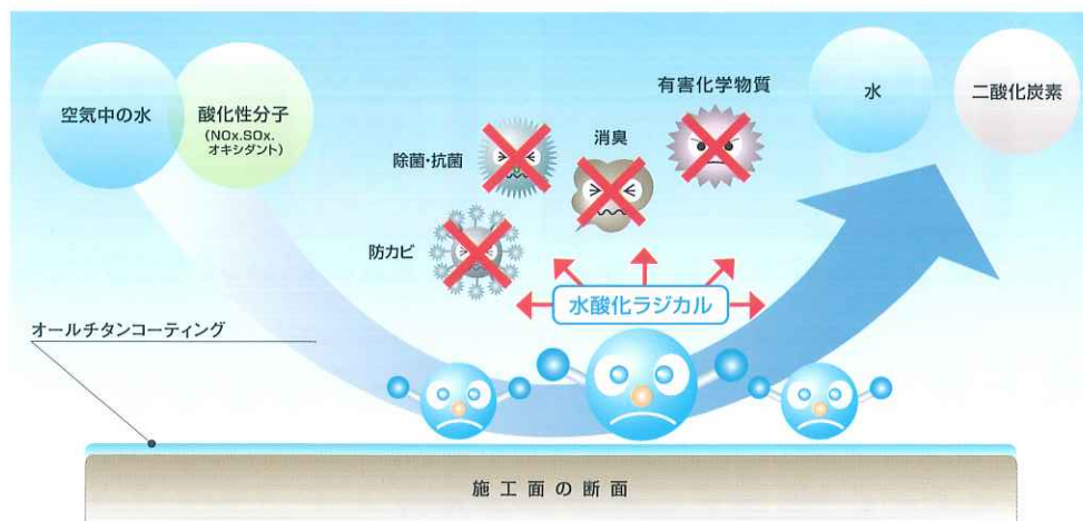
※オールチタンコーティング分解原理イメージ図

オールチタンを噴霧し、完全硬化した対象物表面に空気中の水と酸化性分子が接触することで表面反応(酸化還元反応)が起こり、強力な酸化力を有する水酸化ラジカルになることで表面に接触した化学物質を分解し、消臭・防カビ・抗菌効果を現出します。