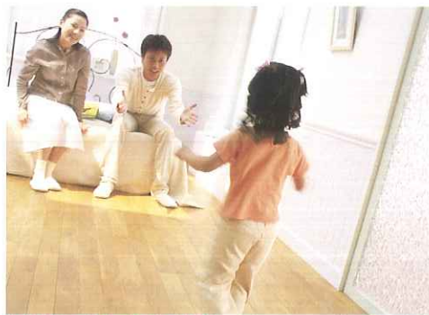
滑りにくく安心・快適

塗膜硬度が高く、ペットのひっかきキズや家具の引きキズから床を保護します。また、UV効果で日焼けも保護します。