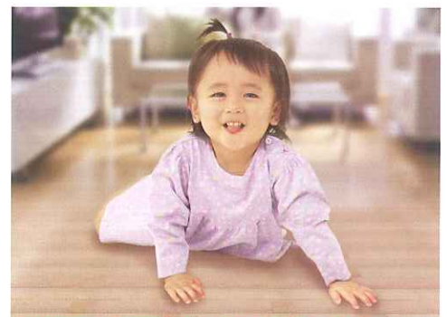
口に入れても無害だから安心で安全

ノンスリップ加工で滑りにくく、歩行時の安全性・快適性が高まります。お年寄りの方やお子様にも安心です。