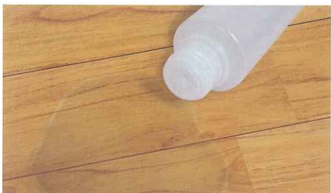
除光液や洗剤をこぼしても心配なし!

昔から有る陶磁器も表面はガラス膜で出来ています。万が一なめてしまっても安心です。