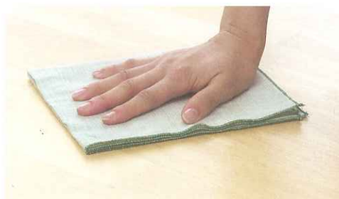
お手入れかんたん! ワックス不要!

普段のお掃除は、水拭き出来て簡単! 塗膜の変色はなく、ワックスがけ不要。「強く」「美しく」床を守ります。