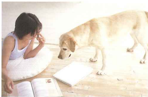
傷つきにくい床! UV効果で日焼けを防止!

ガラスクリアコートは、テトラエトキシシランという、常温硬化する液体ガラスと特殊樹脂・UVカット剤が、ナノレベルで融合しているため、無機質で劣化しない、衝撃に強く割れないガラス膜を実現。生活で生じる傷から床を保護し、美しさを維持することが出来ます。